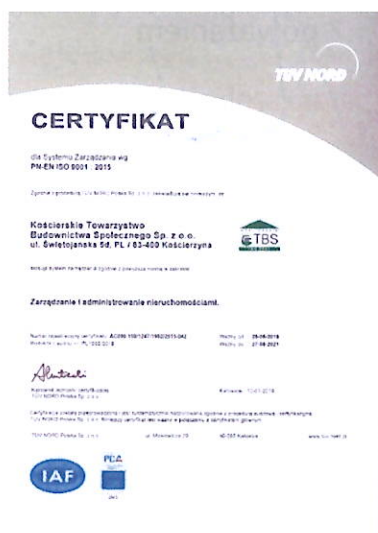
Foto 10. Ostatni certyfikat europejskiej jakości ISO 9001:2015 z sierpnia 2018r.

Ładny baner, stoi nadal tak jak go postaviliśmy na dwudziestolecie działalności KTBS, zrobił się jednak nieprawdziwy nie tylko ze względu na treść głównego hasła: „Zarządzamy nieruchomościami od 20 lat”, ale i posługiwanie się nieuprawnionym logo z symbolem europejskiej jakości zarządzania i administrowania nieruchomościami określonym europejską normą PN-EN ISO 9001:2015, a której to od kilku lat Spółka niestety nie spełnia.