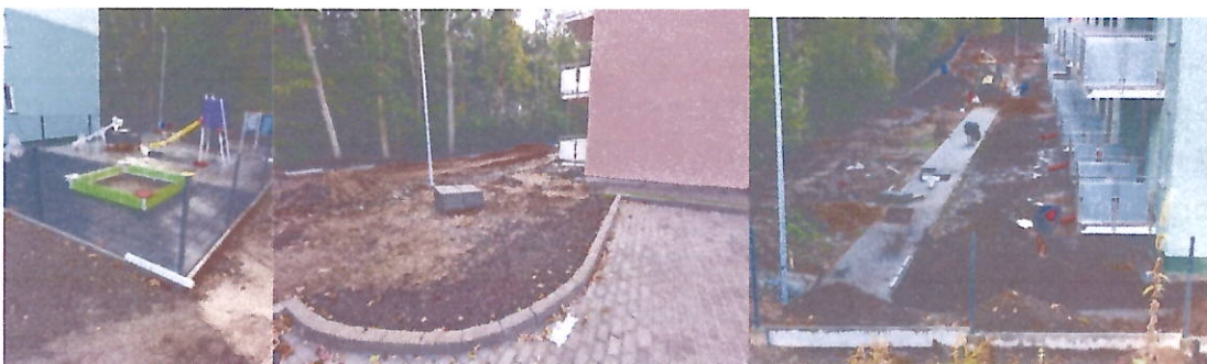
Foto 6-8. Niedokończony plac zabaw, ogrodzenie, chodnik i zieleń wokół budynków.