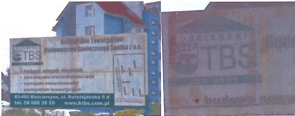
Foto14-15. A to już chyba hańba Kościerskiego TBS sp. z o.o. na ul. Piechowskiego, którą w stronę Szpitala Specjalistycznego przejeżdżają codziennie setki mieszkańców nie tylko Kościerzyny. Podrdzewiała plansza z nieaktualnym logo nie przeszkadza ani władzom Spółki, ani Miasta. Stosowny wydaje się komentarz powiedzeniem: „Jaki pan taki kram”.