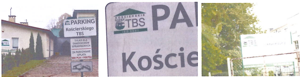
Foto 11-13. Tu kolejny przykład nieuprawnionego stosowania symboliki ISO, na terenie siedziby Spółki, czy przy ulicy Drogowców w Kościerzynie.