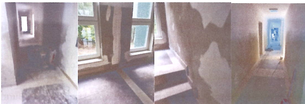
Foto 2-5. Brak powłok malarskich na klatkach schodowych.

tylko zaszkodzić kandydatowi na posła, bo w rozmowie z przedstawicielami wykonawcy zostałem poinformowany, że do zakończenia pozostało jeszcze kilka tygodni.