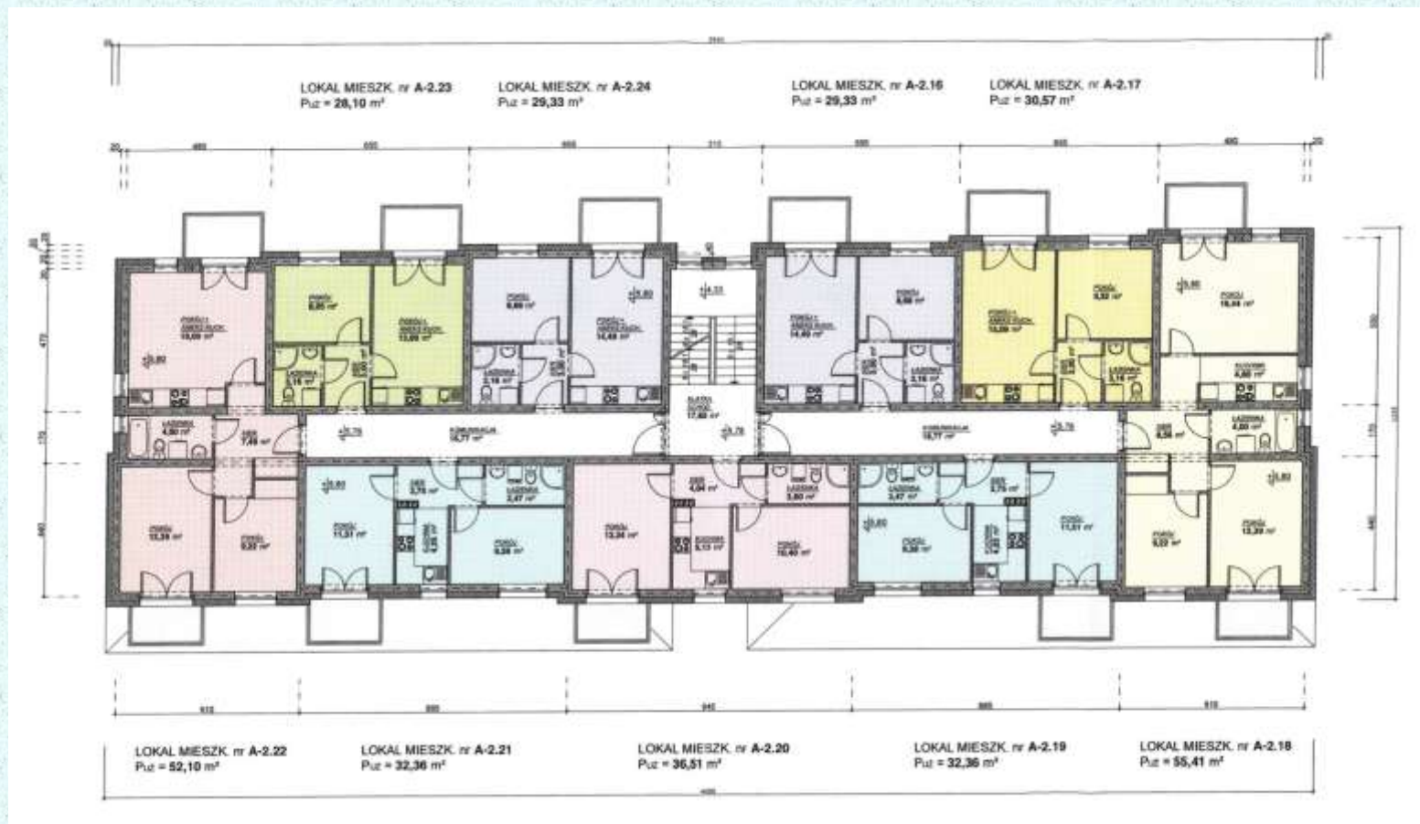
Budynek A - rzut 2 piętra