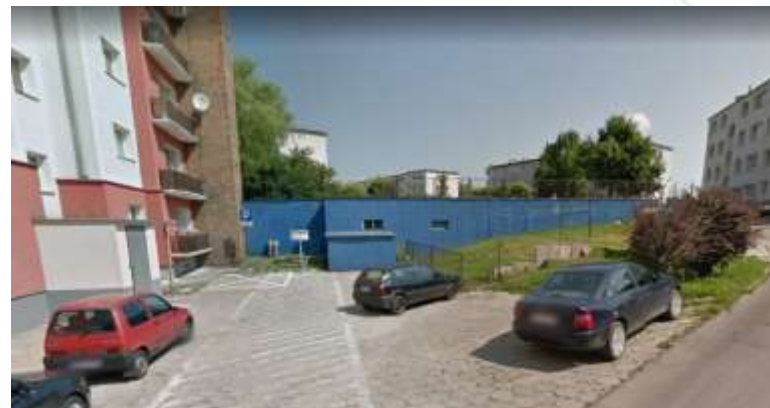
OBIEKT PO BYŁEJ KOTŁOWNI