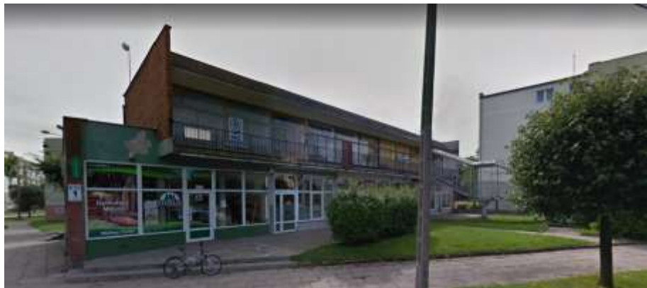
BUDYNEK USŁUGOWY PRZY UL. OSIEDLE 1000-LECIA 1