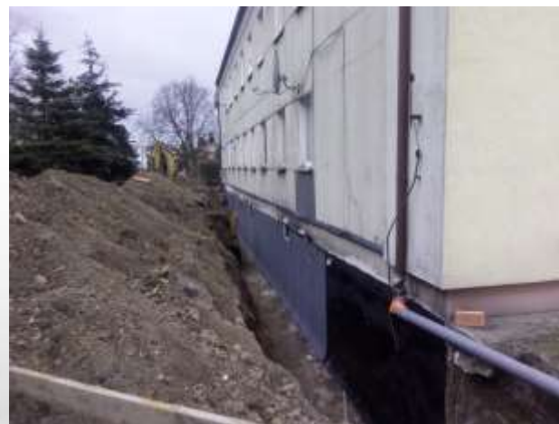
UL. STRZELECKA 26